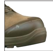
HAIX® Nano-Carbon Schutzkappe